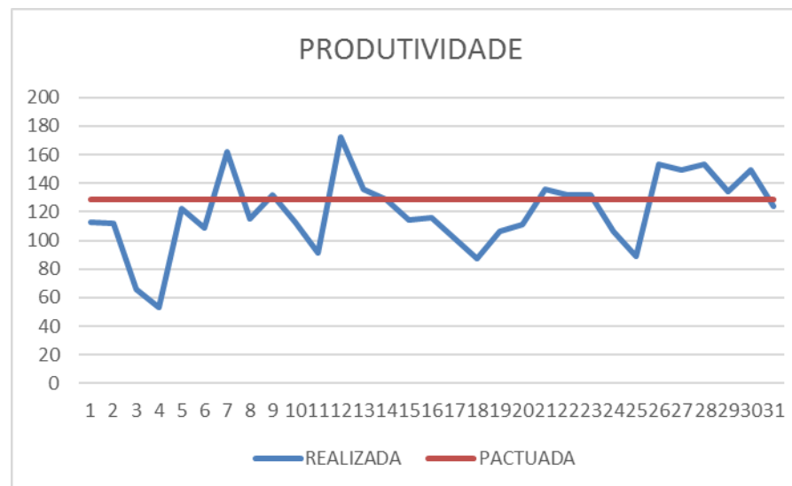
Gráfico de Metas e Produtividade 01 a 31 de julho 2019